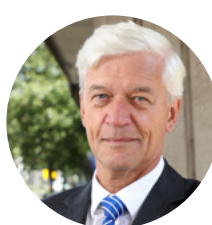
Theo Hofstee Procureur-generaal bij het OM